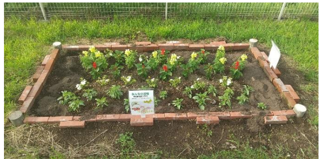
環境と緑の財団の「花いっぱいコンクール」にも参加