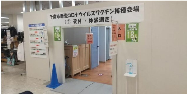
平日の集団摂取会場（イオンの二階です。）

集団接種、クリニック接種が開始されました。社協のネット予約支援もありますので活用して下さい。予約に不安な方は町内会役員に相談して下さい。