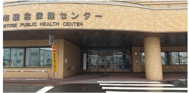
土休日の集団摂取会場（福祉センターです。）